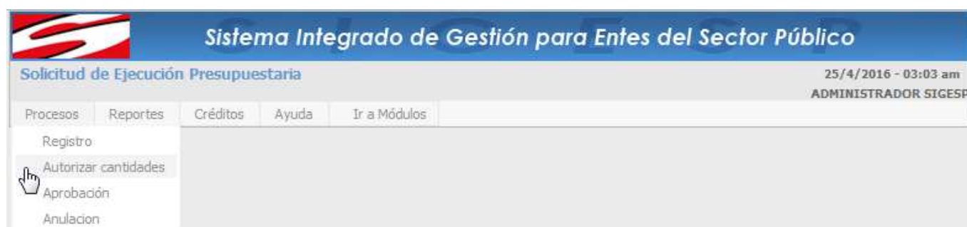
Figura 12. Autorizar cantidades

Esta transacción está asociada al registro previo de una solicitud de ejecución presupuestaria (SEP), su finalidad es autorizar las cantidades de productos, servicios o conceptos que serán definitivamente solicitados, permite modificar las cantidades en la SEP. Para iniciar esta transacción debe ubicar una SEP, utilizando el icono: Buscar de la barra de herramientas de SIGESP. Documento que genera: ninguno.