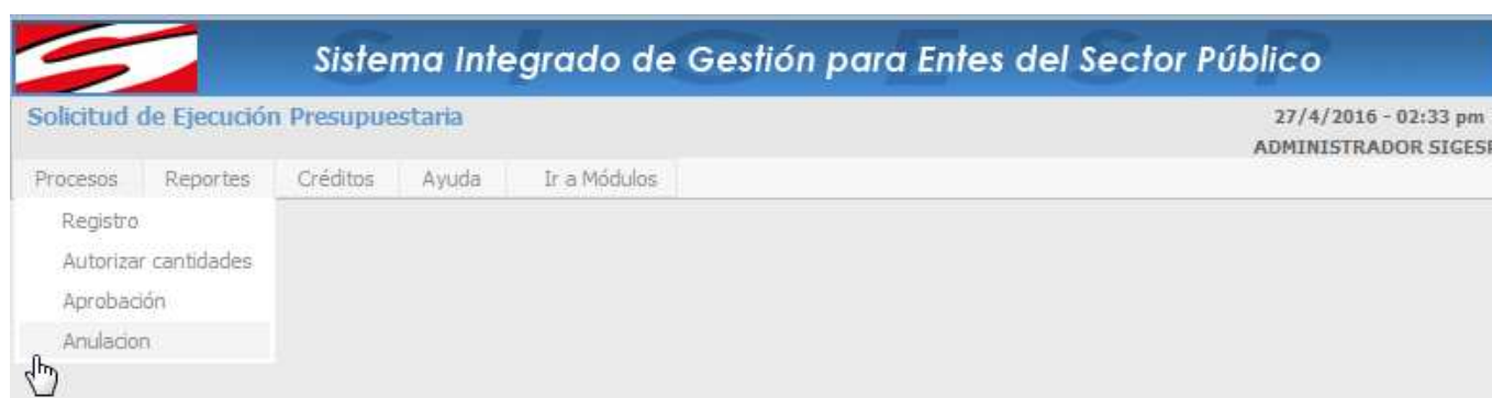
Figura 17. Anulación